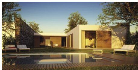
Exterior vale do pisão – Cliente Nortegolf

A LT Studios tomou medidas claras de prevenção em relação ao facilitismo instalado no passado. Executou um plano posto a posto, formatando os discos e instalando todas as licenças necessárias ao funcionamento do mesmo. Realizou um documento que está arquivado na lateral da respectiva workstation com um descritivo das licenças instaladas, data da formação e de cada instalação assinado pela gerência e pelo utilizador.