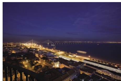
Vista Noturna da Terceira Travessia do Tejo - cliente Rave