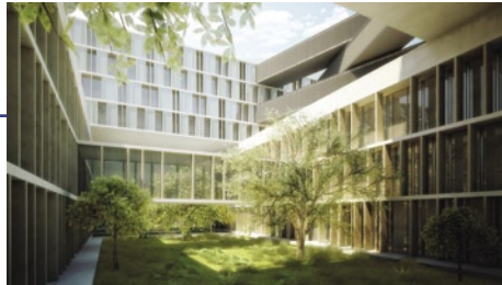
Concurso de Arquitectura Hospital de todos os Santos - Cliente Arq. Souto de Moura