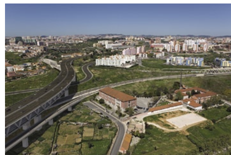
Acessos à Terceira Travessia do Tejo Margem Norte - cliente Rave

“Se realmente existem situações de ilegalidade, estas devem ser resolvidas e as empresas lesadas devem ser ressarcidas das suas perdas. No nosso caso, deparamo-nos com um sólido crescimento e, com a entrada de novos funcionários, justificava-se a compra de mais software. Optámos assim por fortalecer a relação com a Autodesk e simultaneamente fazer crescer o nosso parque informático, adquirindo assim mais capacidade produtiva e assim mais competitividade no mercado.”